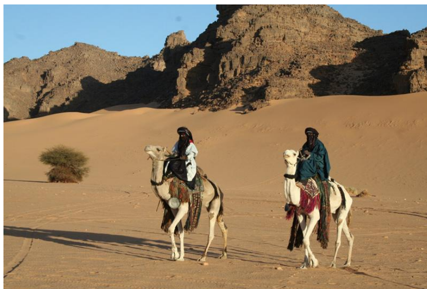
南部塔西里撒哈拉沙漠