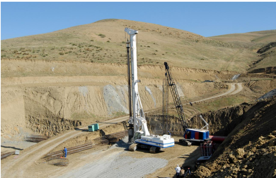
中信—中铁建联合体承建的東西高速公路

【当地中资企业及项目】中资企业在阿已完成的大型承包工程项目有“松树”五星级宾馆、军官俱乐部、阿尔及尔和奥兰喜来登饭店、阿尔及尔国际机场新航站楼、斯基克达凝析油炼厂、东西高速公路、中建承建CHERCHELL绕城高速公路项目、阿尔及利亚大清真寺项目、奥兰体育场项目、阿尔及尔炼厂改扩建（建设）项、南北高速路53公里项目、贝贾亚高速公路连接线项目以及数个水利水坝项目；已进入收尾阶段的大项目有中国港湾承建的斯基克达油气码头改扩建工程，中国土木承建的55公里铁路项目和175公里电气化铁路项目等。