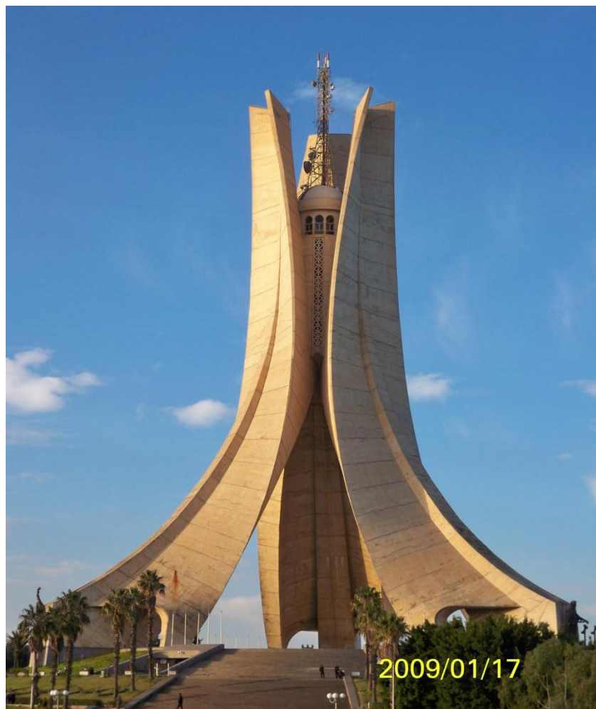
阿尔及尔标志性建筑——烈士纪念塔

阿尔及利亚地形分为地中海沿岸的滨海平原与丘陵、中部高原和南部撒哈拉沙漠三部分。沙漠面积逾200万平方公里，约占国土总面积的85%。阿尔及利亚属于东1时区，比北京时间晚7小时，没有夏令时。