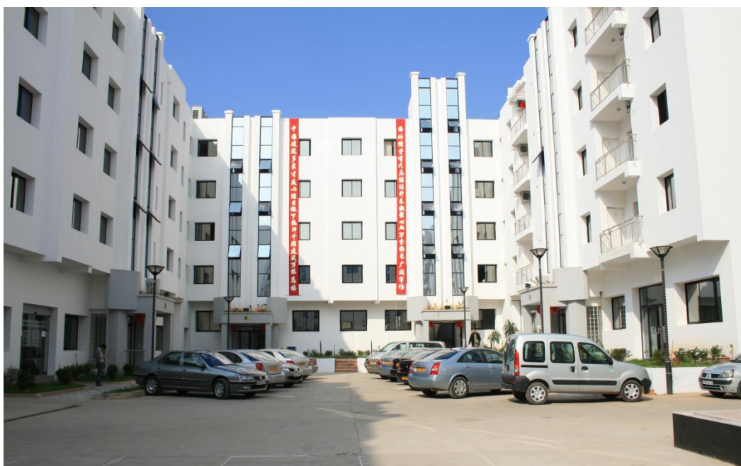
中国建筑股份有限公司驻阿尔及利亚经理部

中国企业在阿尔及利亚整体投资规模不大，主要集中在油气、房地产、建材等行业。主要投资公司有中石化、中建等。主要项目有油气区块勘探开发，目前正积极推进矿业勘探开发投资项目落实。钢铁、软木、饭店、纺织、贸易等方面也有少量私人投资。