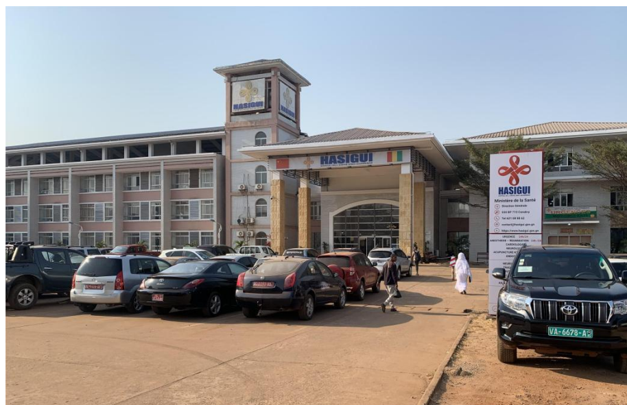
中几友好医院外景

几内亚拥有国家级中心医院3所，即东卡医院、亚斯丁医院和中国政府援建的中几友好医院，各大区国立医院8所，县级医院26所，县级以下各类诊疗站、卫生中心等医疗机构2477个。几内亚药品和医疗设备全部依赖进口，进口国别包括法国、中国、比利时、瑞士、尼日利亚、印度等。全国医护人员总数约12527人，其中20%分布在首都各医疗机构。国家财政分配给卫生领域的投入只占国家预算的6.46%。中方员工人数较多的合作项目，应配备中国医生。据几健康和公共卫生部年报显示，2020年几内亚全国医疗卫生总支出占GDP的21.6%。