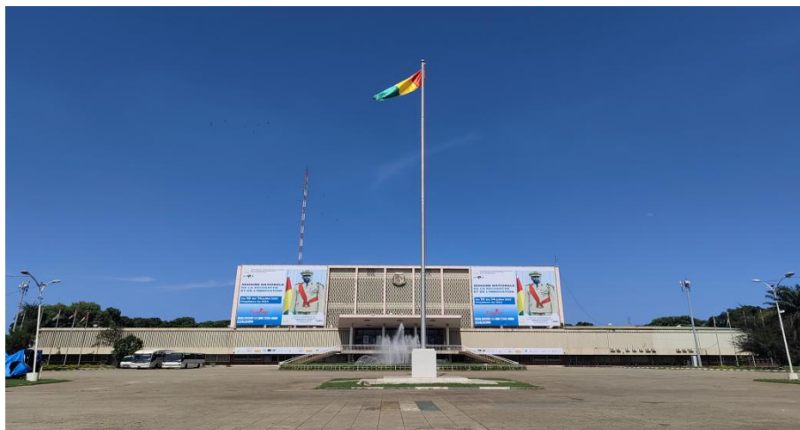
中国政府援建的几内亚人民宫