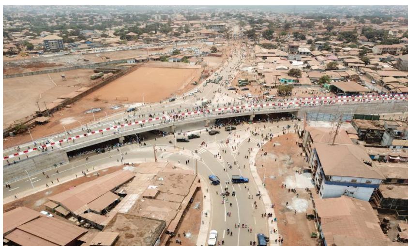
蚌埠国际承建的KAGBELEN立交桥