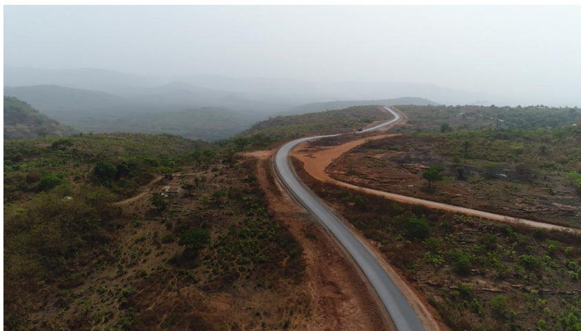
中国路桥承建的几内亚一号国道修复工程项目

近年来，中资企业积极参与几内亚道路桥梁等基础设施建设，道路条件的改善不仅促进了几内亚贸易流通，还降低交通事故发生率，为几内亚人民出行带来便利。