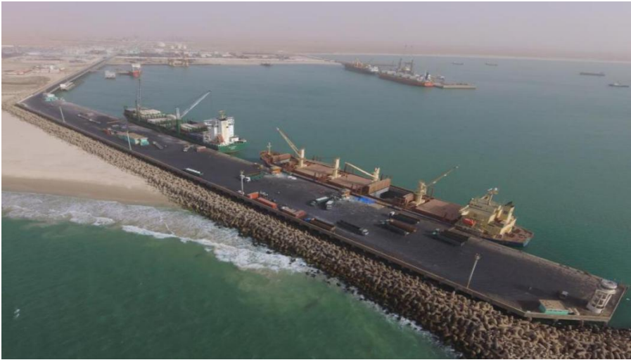
投入使用的友谊港1、2、3#泊位