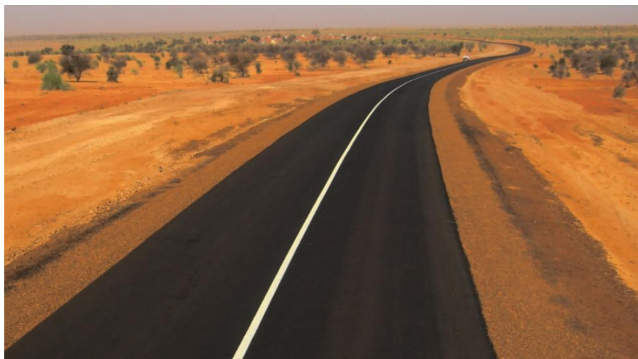
罗索-博盖公路2标段，全长94公里

目前，首都努瓦克肖特至各省会均有公路连接。其中多数是柏油路，少数是加固土路。2023年，全国公路约1.4万公里。主要的公路有努瓦克肖特-布提里米特-阿莱格-基法-阿云-内马公路，全长1100公里，向东通往马里，称为“希望公路”；努瓦克肖特-努瓦迪布公路，493公里向北通往西撒哈拉和摩洛哥；努瓦克肖特-罗索公路，203公里南经罗索通往塞内加尔；努瓦克肖特-阿克茹特-阿塔尔公路，451公里向东北方连接祖埃拉特铁矿区通往阿尔及利亚边境。提季克贾-基法-寒利巴比公路长350公里，连接塔岗省省会提季克贾、阿萨巴省省会基法、吉迪马卡省省会塞利巴比三市。总体路况参差：主干干线与港口连线为公路并维护较好，但大量县乡道路和通向偏远地区的道路为土路或未改良路，雨季/沙侵会造成通行受阻。