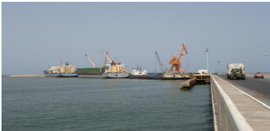
中国援建毛友谊港码头

努瓦迪布港拥有渔港、商业港和铁矿砂出口专用港。渔港有两个分别长290米和298米的码头。商业港有两个分别长128米和110米的码头（其中一个使用西班牙贷款修建，但因无配套，无法使用）。毛里塔尼亚国家工业和矿业公司（SNIM）拥有一个专用矿石出口码头。该码头2022年的装船量为约1330万吨铁矿石，可停靠15-20万吨级货轮。目前，毛政府正积极推动建设新的深水港。