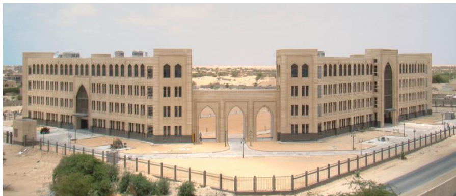
毛里塔尼亚外交部和经济部

从地理、文化、社会等方面看，毛既是阿拉伯国家，又是非洲国家，被称为阿拉伯—非洲之桥。因此，它兼有阿拉伯和非洲的风俗习惯。