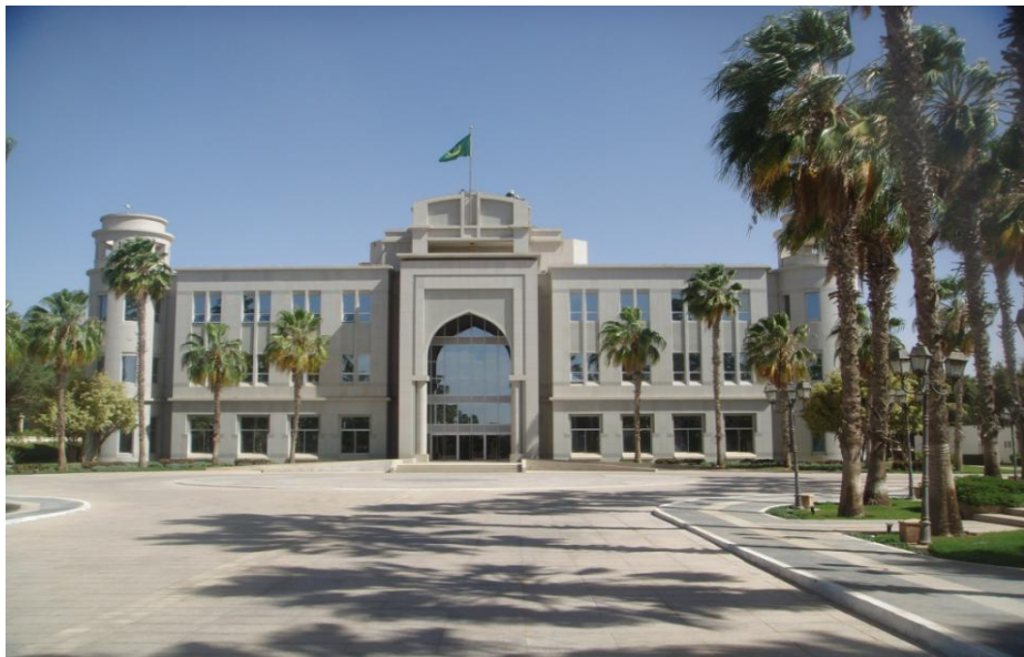
毛里塔尼亚总统府