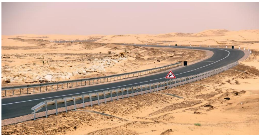
Atar-Tidjikja公路第三标段项目