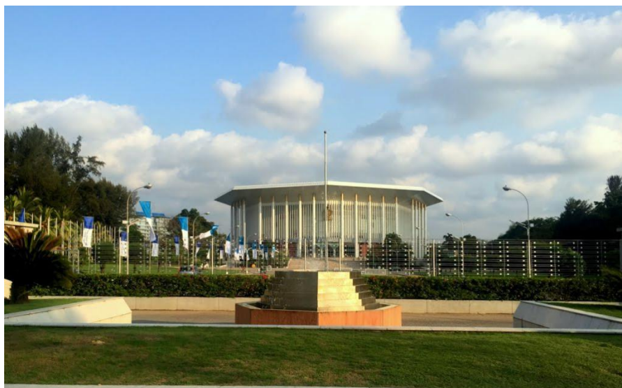
斯里兰卡纪念班达拉奈克国际会议大厦

努沃勒埃利耶：意为城市之光，位于斯中部，坐落在斯第一高峰皮杜鲁塔拉噶拉山麓，海拔1896米，有“东方瑞士”“小英伦”之称，人口约78万，距科伦坡180公里。