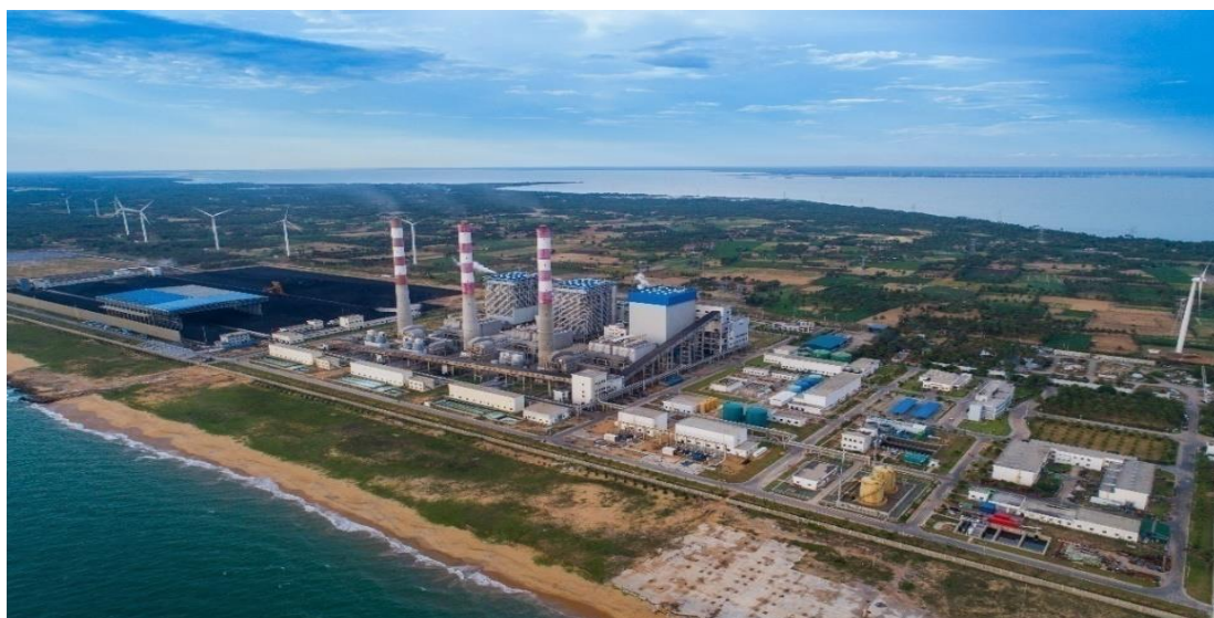
普特拉姆燃煤（Lakvijaya）电站