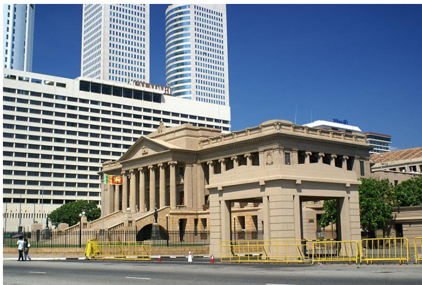
总统秘书处办公楼

【总统】总统为国家元首、政府首脑和武装部队总司令，享有任命总理和内阁成员的权力。总统戈塔巴雅·拉贾帕克萨于2019年11月大选中胜出并就任总统，原本任期5年。2022年7月9日，斯爆发大规模游行示威活动，抗议者占领总统府；12日，戈塔巴雅离境，15日正式宣布辞职。20日，拉尼尔·维克拉马辛哈在议会选举中胜出，21日宣誓就任总统。2024年9月21日，阿努拉·迪萨纳亚克在斯里兰卡总统选举中胜出，当选新一任总统并于23日宣誓就职。