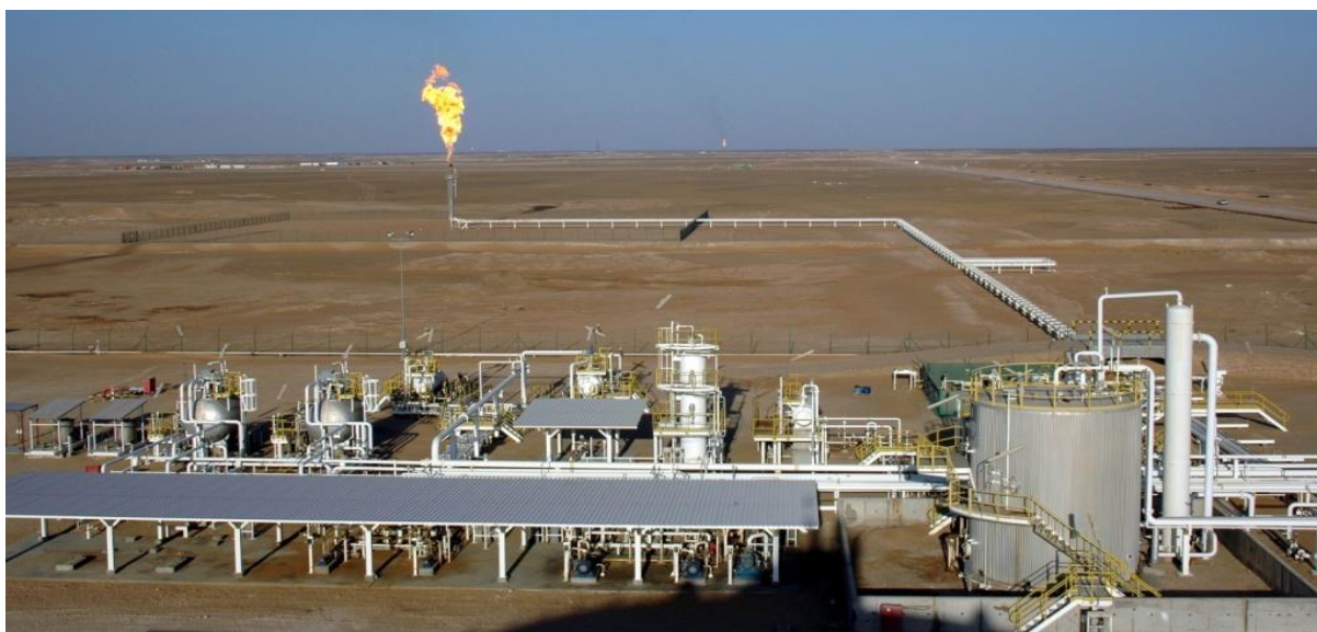
中石油阿曼5区块作业现场

【阿曼对华投资】 2020年，阿曼投资局（OIA）与中国招银国际（CMBI）共同建立CMBI新动量基金。据OIA官网报道，基金规模至少为3亿美元，双方出资比例为50/50。基金通过证券市场投资中国境内的信息通信技术、新能源、医疗保健和物流等行业。