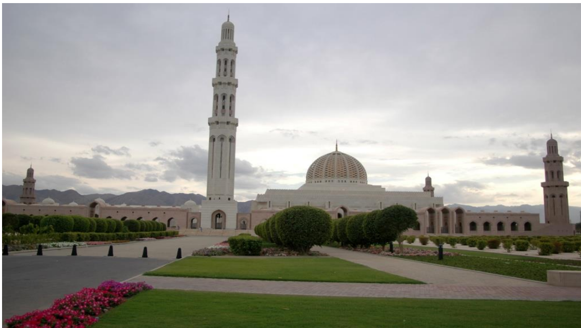
苏丹卡布斯大清真寺

【礼仪】阿曼人大多热情好客，遇到陌生人总是主动打招呼，并热情问候。客人相见时，一般都要先互致问候，然后再行拥抱礼和亲吻礼。对女性一般不主动握手，也不能过分亲近和交谈，或拍摄女性照片。