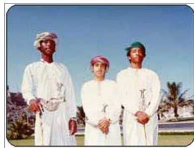
阿曼人的正式着装

【服饰】阿曼男子虽与大多数阿拉伯人一样穿无领长袖大袍、戴头巾，但有明显的不同：一是袍子的领口右侧垂有花穗，可以蘸注香水；二是头巾质地讲究，有很漂亮的花纹，扎缠在头，与沙特等国不同。在正式场合，男子一般习惯穿无领长袍，扎缠头巾，佩带弯刀，脚穿露出脚指的皮凉鞋。妇女喜饰金，服装艳丽。阿曼人能歌善舞，不过一般都是女歌男舞，男人在圈中欢快地跳舞，妇女则在外面以拍手唱歌伴舞。