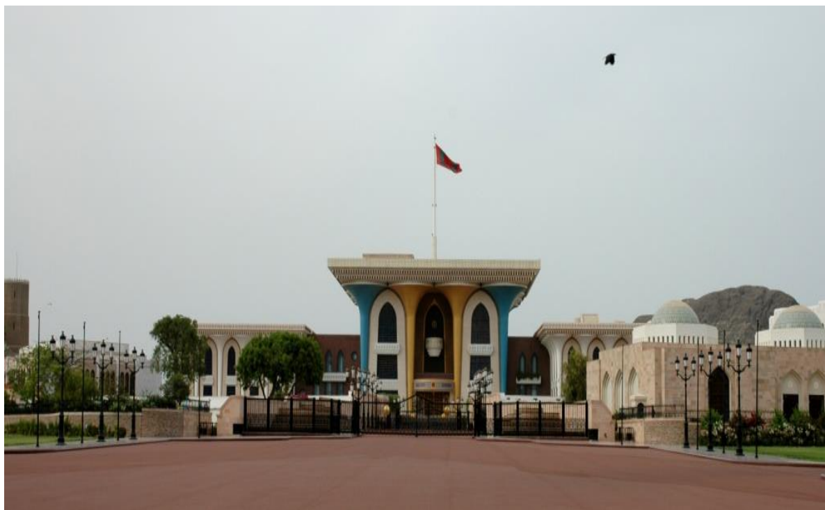
旗帜宫--苏丹重大礼仪活动地

【首都】马斯喀特位于阿曼东北部，地处波斯湾通向印度洋的要冲，三面环山，东南濒阿拉伯海，东北临阿曼湾，面积约为3900平方公里。截至2023年底，人口约为145.6万，本国人口约54万、外籍常住人口约92万。马斯喀特由6个行政区组成，分别是马特拉、巴夫沙尔、希卜、阿姆拉特、马斯喀特和库拉亚特，市政规划有序，街道整齐，绿化美观，建筑富有民族特色。市内拥有距今400多年历史的著名的贾拉里古城堡等名胜古迹，还有皇家歌剧院、旗帜宫、卡布斯大学、卡布斯体育中心、卡布斯皇家医院、布斯坦宫饭店、马特拉集市等著名地标。马斯喀特已成为阿曼政治、经济、文化和商业中心。