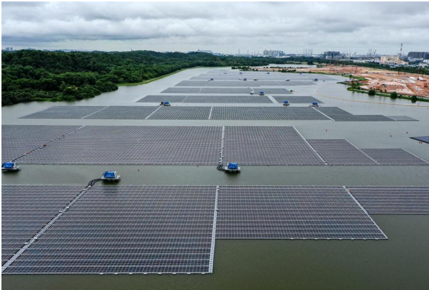
中国能源建设集团山西公司承建登加蓄水池水上光伏项目

在该项目中，中冶秉持打造“城市中的森林”的设计理念，致力于建设一个环境舒适、资源友好的绿色建筑。在资源利用方面，使用环保可再生材料进行建造，配合有效的用水及能源的监测系统，将建造施工以及后期运营过程中所产生的能耗和对环境的影响降到了最低。同时，通过智能技术建立系统反馈机制，实现室内环境精准控制，在建筑的全生命周期实现了环保、健康、节能。项目取得新加坡最高级别的绿色建筑标准白金级认证。