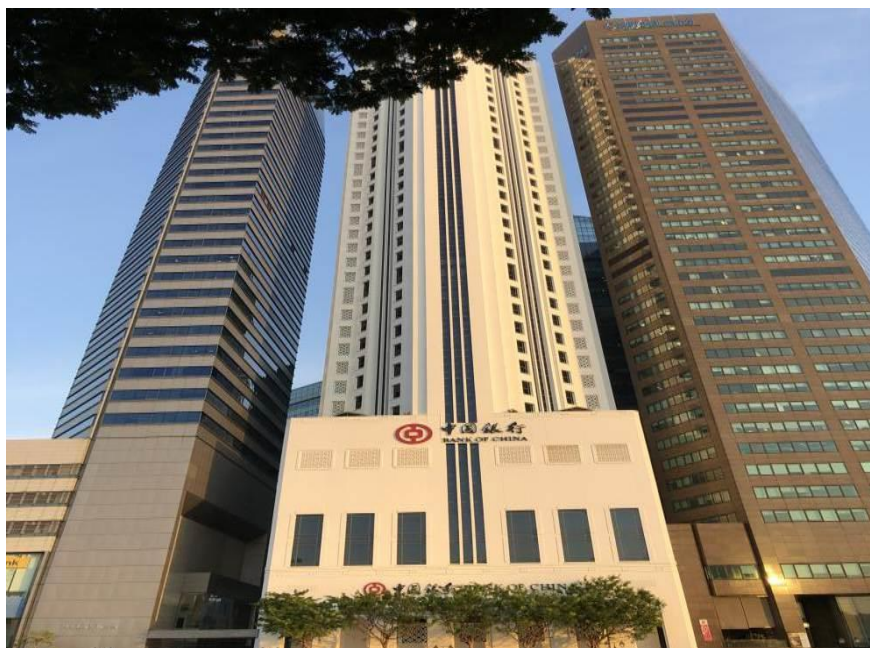
中国银行新加坡分行

【市场准入】保险公司的最低实缴资本为1000万新元（约合4830万元人民币），但只经营投连险或短期意健险的保险公司的最低实缴资本为500万新元（约合2415万元人民币），再保险公司最低实缴资本为2500万新元（约合1.2亿元人民币）。