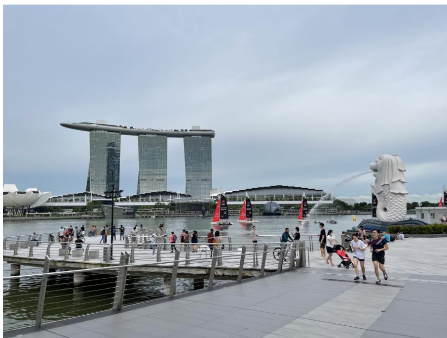
新加坡鱼尾狮公园

新加坡古称淡马锡。8世纪属室利佛逝王朝，18-19世纪是马来柔佛王国的一部分。1819年英国人史丹福·莱佛士抵达新加坡，与柔佛苏丹签约，开始在新加坡设立贸易站。1824年新加坡沦为英国殖民地，成为英国在远东的转口贸易商埠和东南亚的主要军事基地。1942年被日本占领。1945年日本投降后，英国恢复殖民统治，次年划为其直属殖民地。1959年实现自治，成为自治邦，英国保留国防、外交、修改宪法、宣布紧急状态等权力。1963年9月16日与马来亚、沙巴、沙捞越共同组成马来西亚联邦。1965年8月9日脱离马来西亚，成立新加坡共和国。