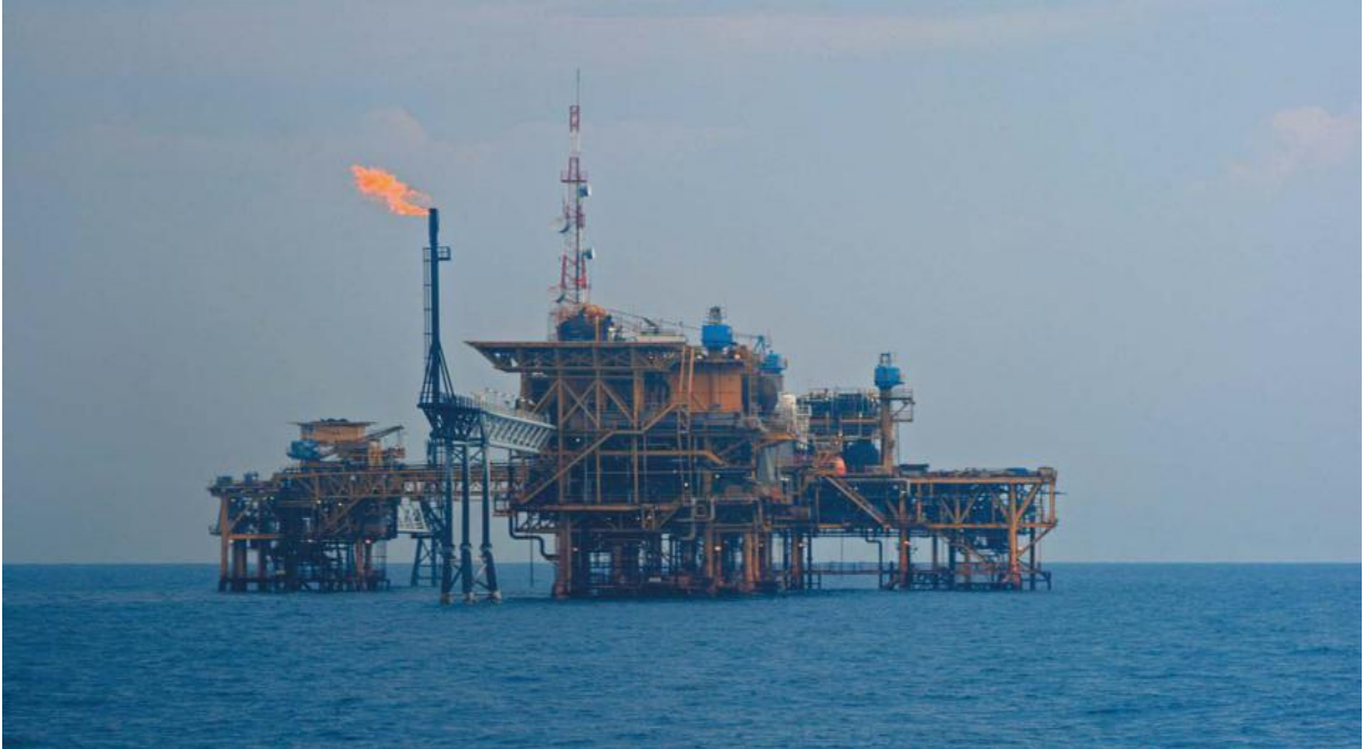
中海油在印尼的作业平台