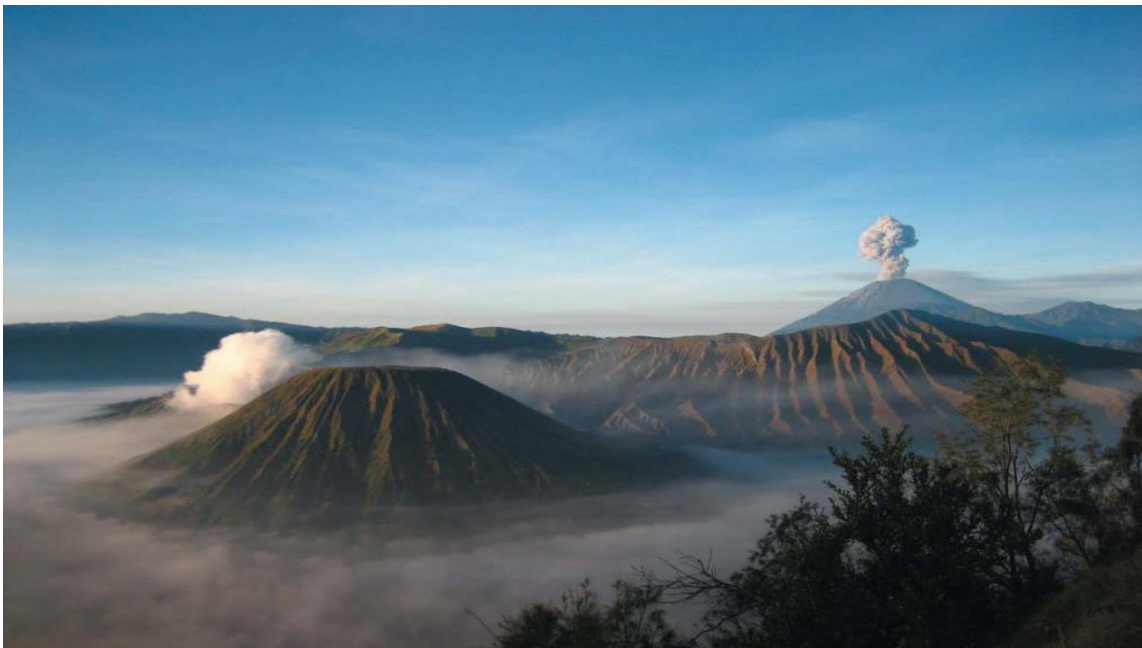
印尼著名的活火山—BROMO火山

印度尼西亚（以下简称印尼）位于亚洲东南部，由太平洋和印度洋之间的17508个大小岛屿组成，是世界上最大的岛国、最大的群岛国家，国土面积191.4万平方公里，海洋面积316.6万平方公里（不包括专属经济区）。包括苏门答腊岛、爪哇岛、苏拉威西岛以及婆罗洲和新几内亚的部分地区。与巴布亚新几内亚、东帝汶、马来西亚接壤，与泰国、新加坡、菲律宾、澳大利亚等国隔海相望。