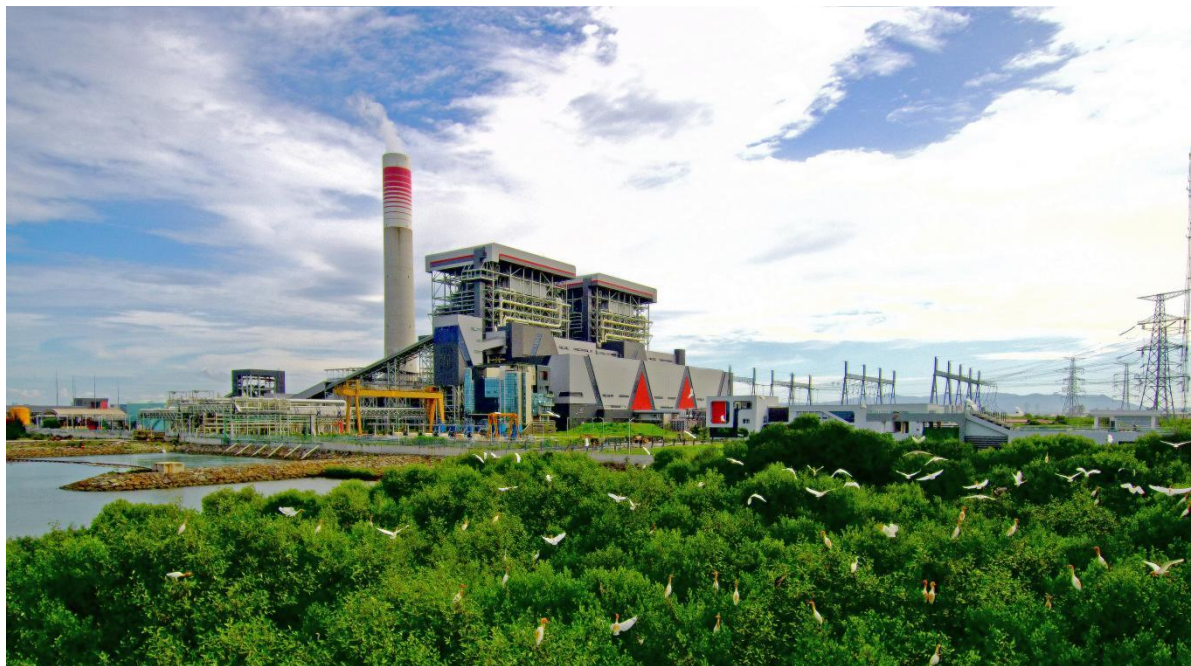
国华印尼爪哇7号项目