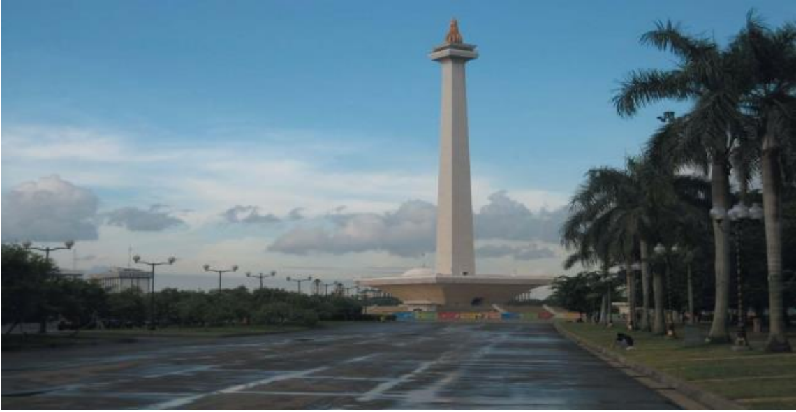
印尼独立纪念碑广场